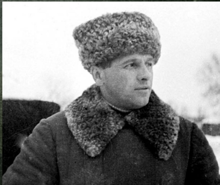
Лев Михайлович Доватор. Командир 2-го гвардейского кавалерийского корпуса, 16-й армии Западного фронта, гвардии генерал- майор кавалерии