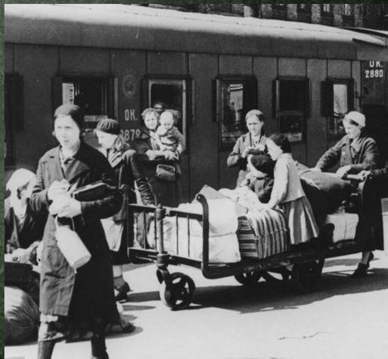
Сведения о количестве эвакуированного населения, находившегося в городе Ставрополе. 1945 год.

Архивный отдел управления делопроизводства и архива администрации города Ставрополя. Ф. 38, оп. 2, д. 9, л. 12