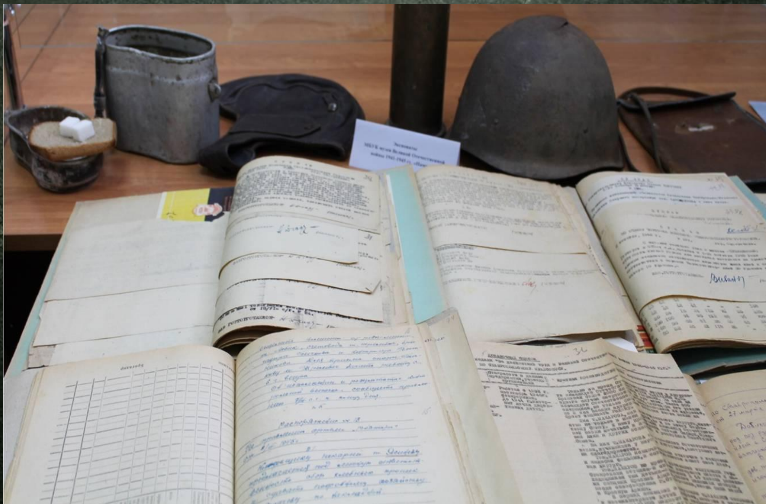
Подлинные документы времен Великой Отечественной войны, экспонируемые архивным отделом управления делопроизводства и архива администрации города Ставрополя во время проведения историко-документальных выставок